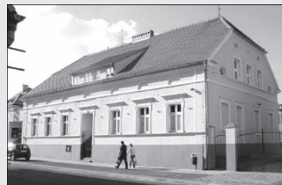
Wyremontowany budynek Zespołu Szkół Usługowo-Gospodarczych