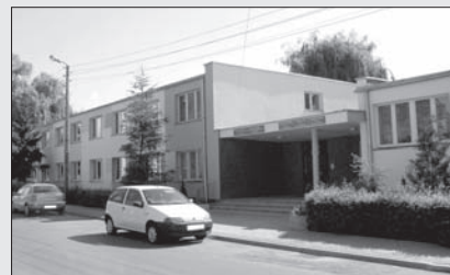
Budynek Zespołu Placówek Opiekuńczo-Wychowawczych po remoncie