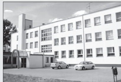
Odnowiony obiekt Zespołu Szkół Technicznych