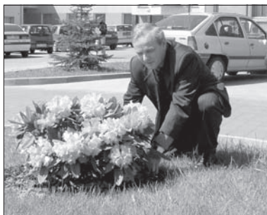
Szef niemieckiej delegacji ofiarował pleszewskiemu wicestaroście sadzonkę rododendronu - drzewka, które jest symbolem Powiatu Ammerland. Krzew został posadzony na trawniku przed Starostwem Powiatowym w Pleszewie.

Polscy i niemieccy muzycy dali w sumie dwa koncerty. Pierwszy z nich odbył się w Domu Parafialnym im. Piotra Skargi w Pleszewie 6 maja, natomiast drugi, dzień później, w „Starej Powozowni” przy zamku w Gołuchowie. Wystąpił chór „Capella Vocale Westerstedt” i orkiestra kameralna z Ammerland oraz - z polskiej naszej strony - Chór „Ave Sol” i zespoły instrumentalne z Państwowej Szkoły Muzycznej I stopnia w Pleszewie. Najważniejszym punktem programu była śpiewna „Missa brevis Sancti Joannis de Deo” Josepha Haydna. Zorganizowano także dwa towarzyskie mecze piłkarskie między oldbojami z Powiatu Ple-