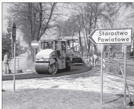
Remont dojazdu do Starostwa Powiatowego

Powiat Pleszewski przeprowadzi kilkanaście inwestycji i remontów na drogach powiatowych. Nowe nawierzchnie asfaltowe zostaną położone na 5 odcinkach i będzie ich łącznie prawie 11 kilometrów. Nowe chodniki powstaną w osmiu miejscach, a ich długość wyniesie w sumie 3.310 metrów bieżących. Część inwestycji jest zakończona, a część na etapie realizacji. Władze powiatu wymagają też na firmie budownictwa drogowego poprawę jakości drogi z Pleszewa do Chocza, którą