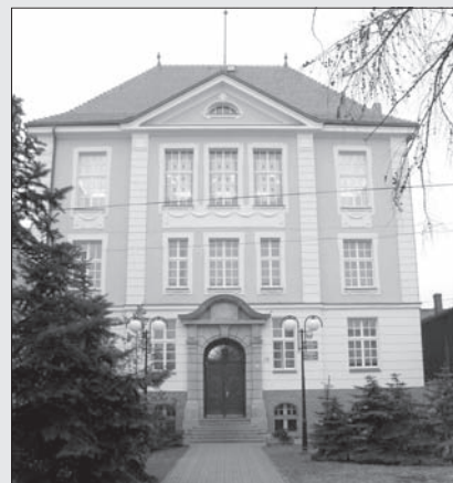
Odnowiona elewacja / Liceum Ogólnokształcące im. St. Staszica