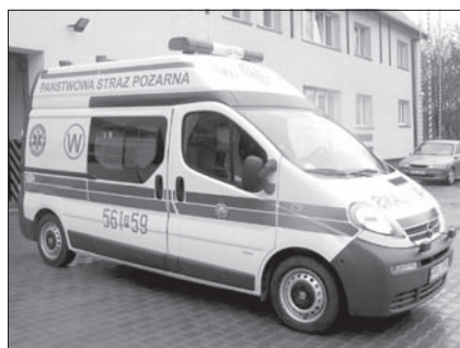
Nowa karetka wypadkowa „W” dla Powiatu Pleszewskiego

Karetka „W” będzie służyła Centrum Powiadomienia Ratunkowego do zabezpieczenia akcji strażackich, wsparcia działań pogotowia ratunkowego oraz do ćwiczeń adeptów pleszewskiej Szkoły Ratowników Drogowych. Jej zaopłaconie stanowi kierowca i ratownicy medyczni. (tw)