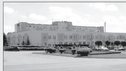
Szpital powiatowy po termomodernizacji